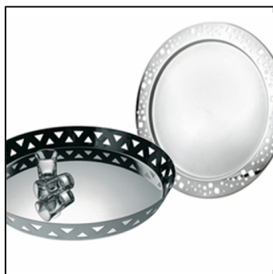
plateau inox MOON dia 38cm

Le plateau de service est un outil indispensable pour les serveurs en salle. Nous vous proposons plusieurs modèles de plateau limonadier. Ces plateaux sont conçus pour le service en salle ou font office de plats de présentation sur vos buffets ou bar.