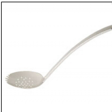
cuillère glaçon argent

Pour assurer vos services, pensez à vous équiper avec les bons ustensiles ! Nos couverts de service argent allient utilité et élégance.